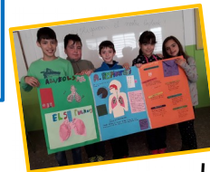
El cos humà